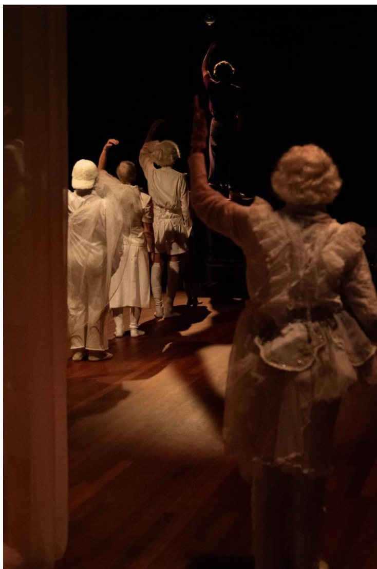
Onze laatste dag