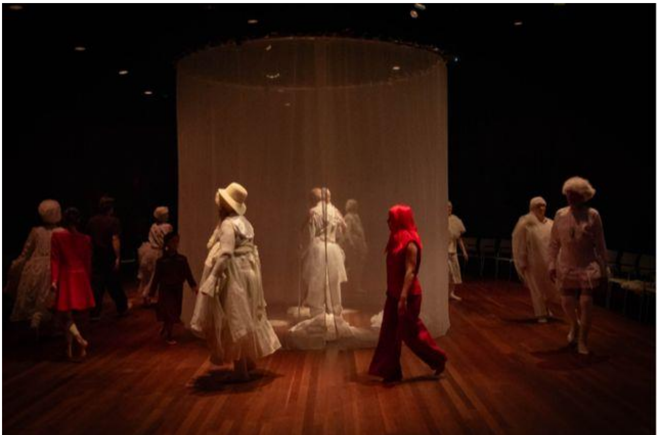
Onze Laatste Dag

We willen de lijnen van onze twee belangrijkste thema's in deze vier jaren bij elkaar gaan brengen; samenspel met mensen met dementie, tot in de allerlaatste fase; een muzikaal ritueel rond een bed, samen met de familie. En 'Onze Laatste Dans' ; een voorstelling over doorgaan tot het niet meer gaat en afscheid van het leven. Ook hierin gaat het om een interactieve zoektocht met het publiek en spelers samen, naar een theateraal afscheidsritueel. Dit geldt tegen die tijd waarschijnlijk ook voor een aantal van onze eigen spelers die ook steeds een jaartje ouder worden (De oudste is 98 en de 'jongste' oudere is 77).