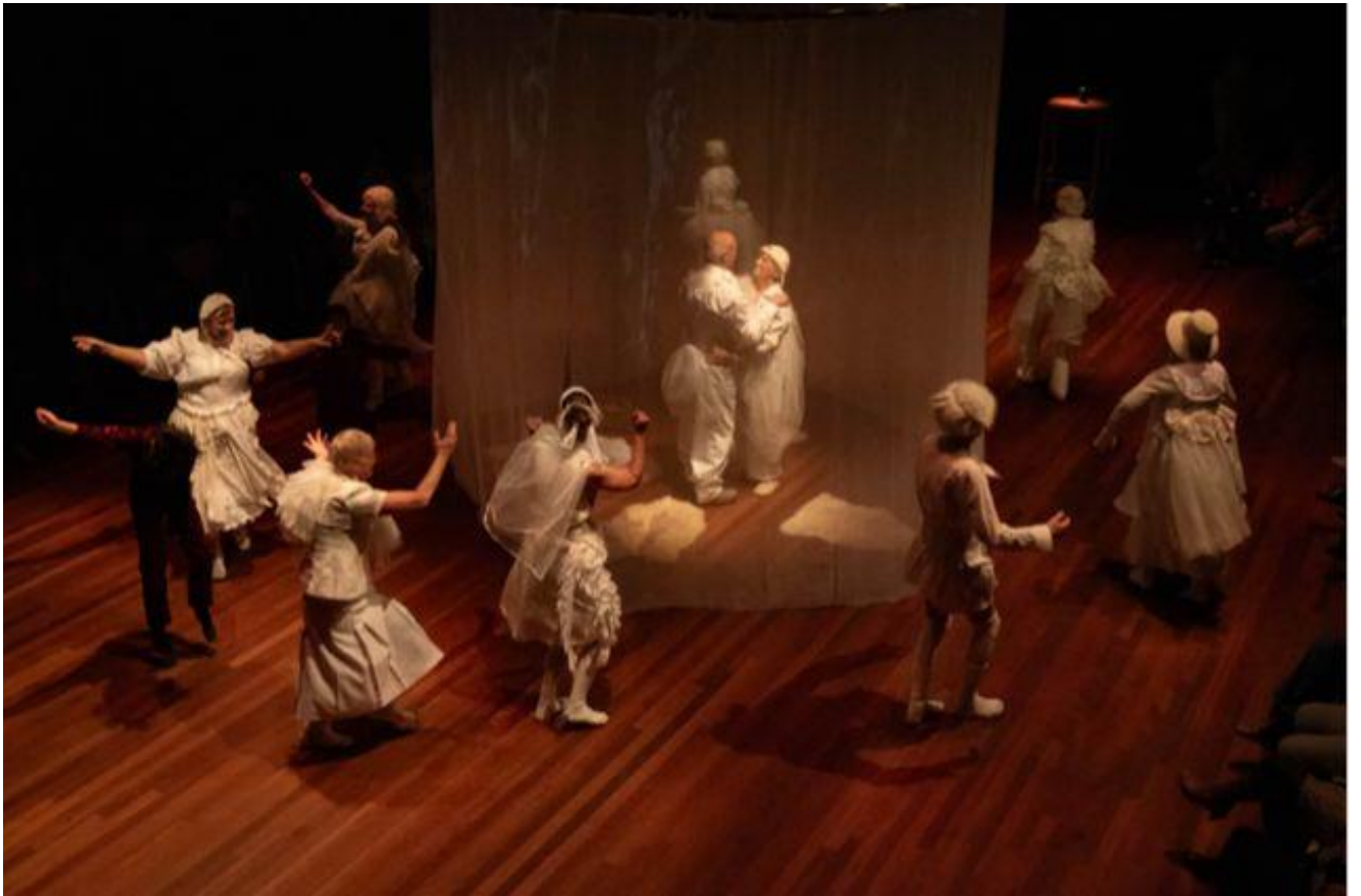
Onze Laatste Dag